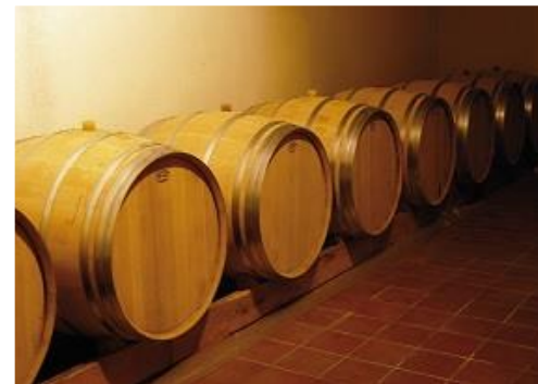
Une barrique de 350 Litres